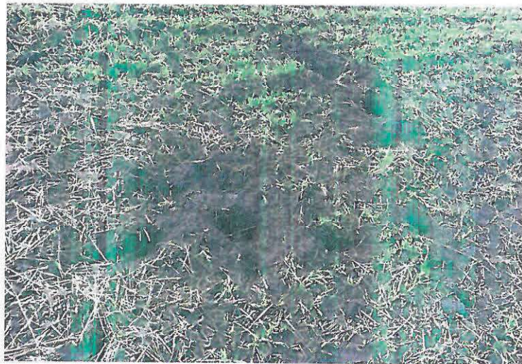
Vatră de atac