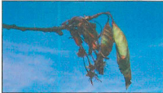
Monilioză pe lăstar, frunze, flori