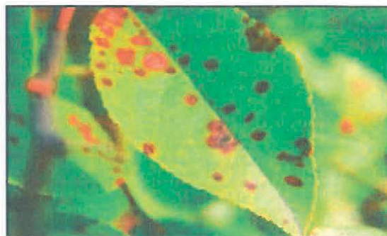
Pătarea roșie a frunzelor