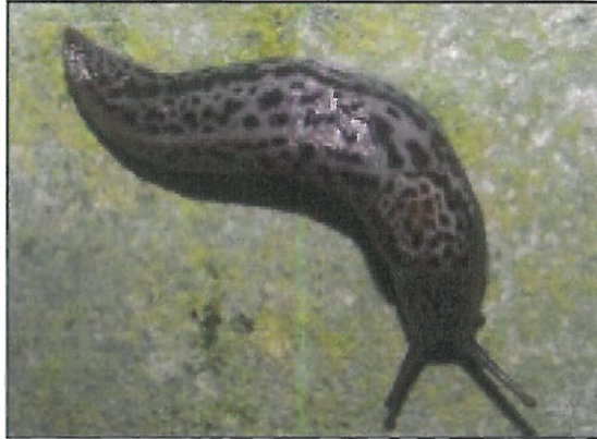
Melci fără cochilie (limacși)

Anexă la Buletin de avertizare nr. 19 din 25 aprilie 2025