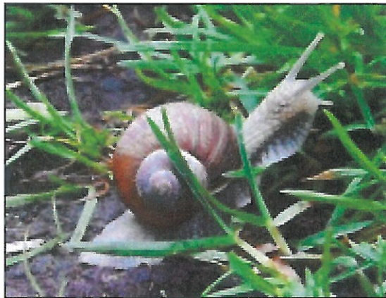
Melci cu cochilie