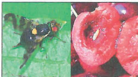
Viermele (musca) cireșelor - adult și larvă în fruct