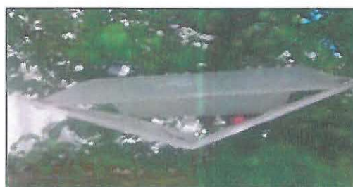
Capcană cu feromoni