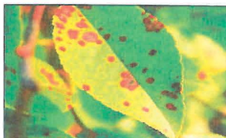
Antracnoză pe frunze