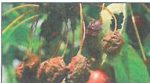
Monilioză pe fructe