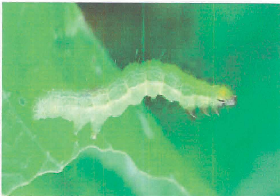
Autographa gamma - larvă