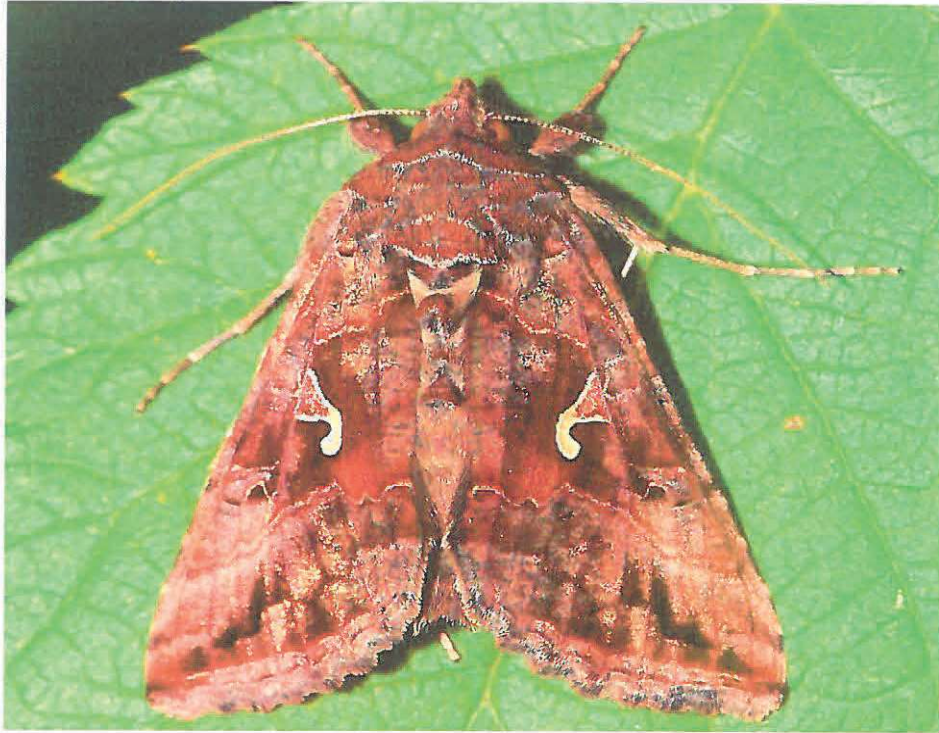
Autographa gamma - adult