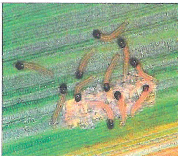
Larve de Sfrederitorul porumbului