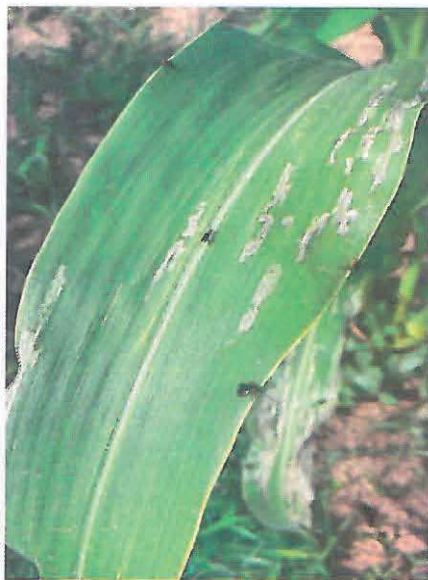
Adulți și atac produs de Viermele vestic al rădăcinilor