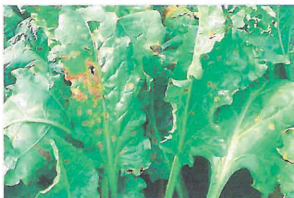
Pătarea frunzelor de sfeclă