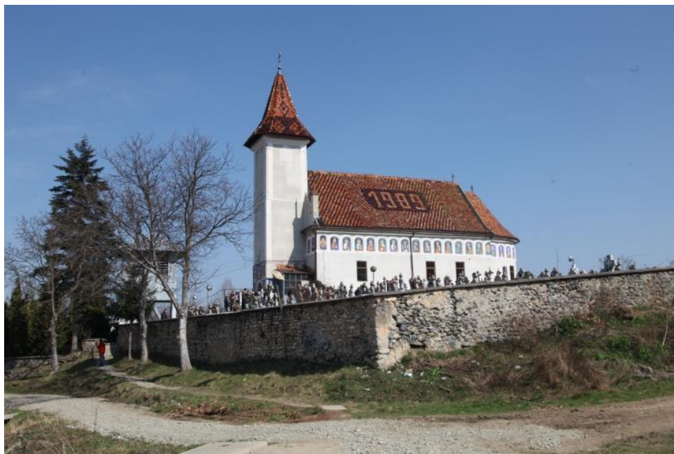
Biserica Sebeșu de Jos