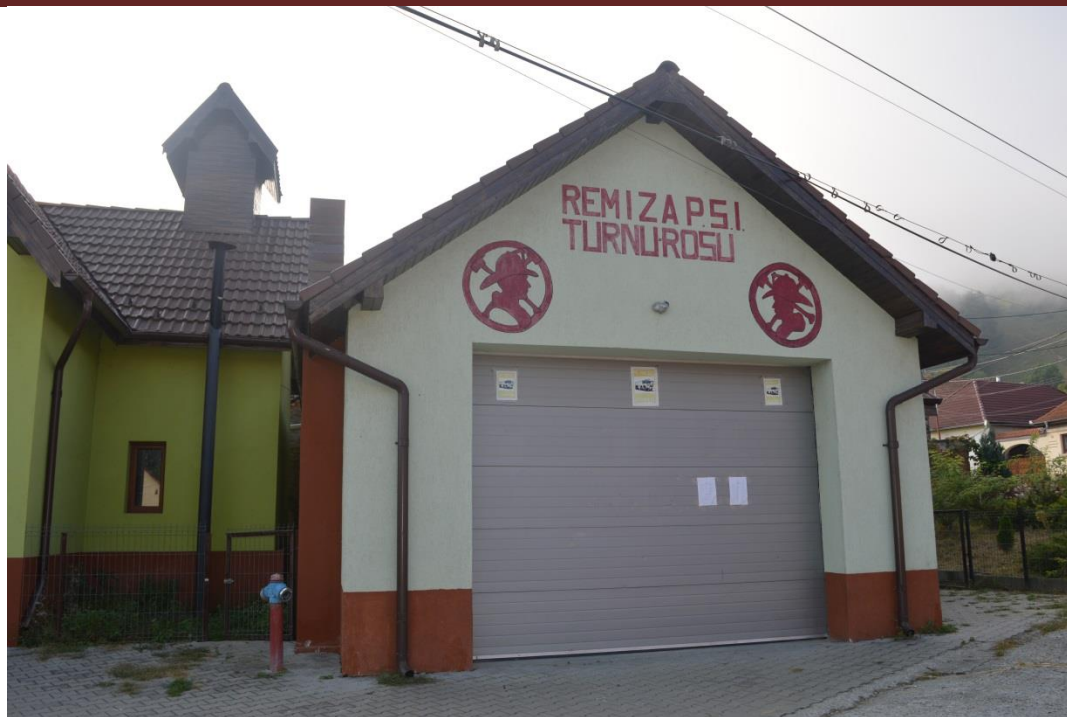
Remiza PSI Turnu Roșu