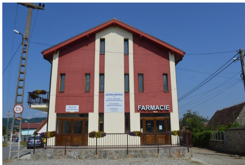
Centrul Medico-Social Turnu Roșu