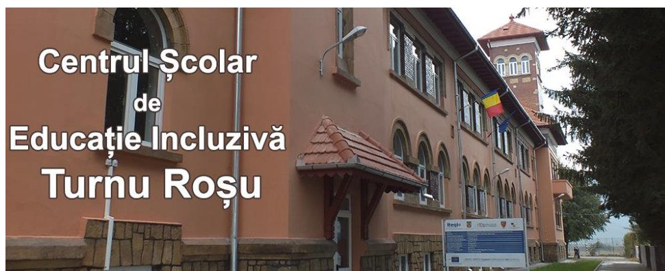
Centrul Școlar de Educație Incluzivă Turnu Roșu