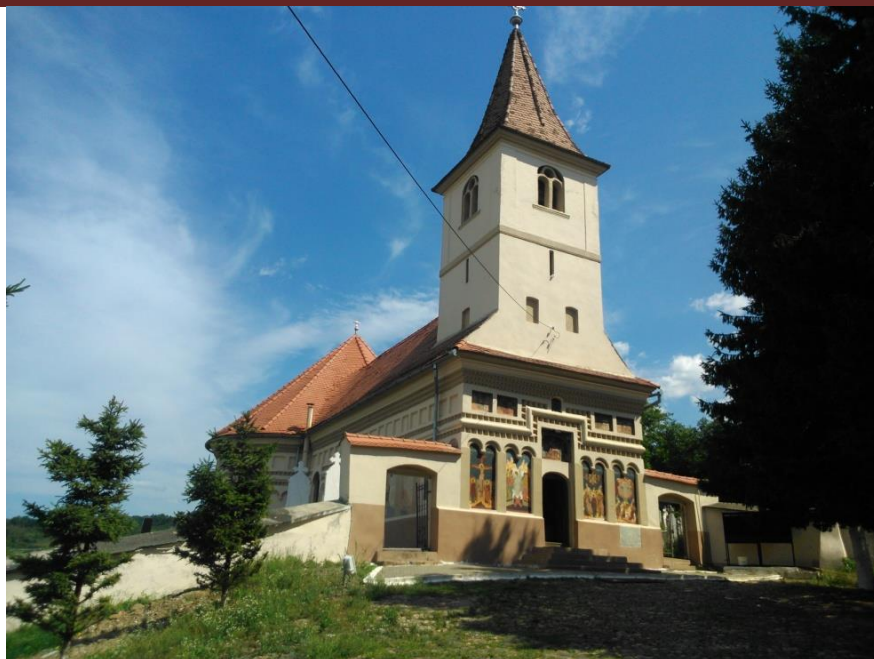
Biserica „Sfântul Nicolae,, Turnu Roșu