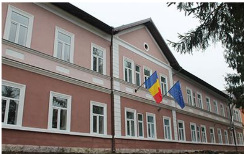
Centrul de Plasament Pentru Copilul cu Dizabilități Turnu Roșu