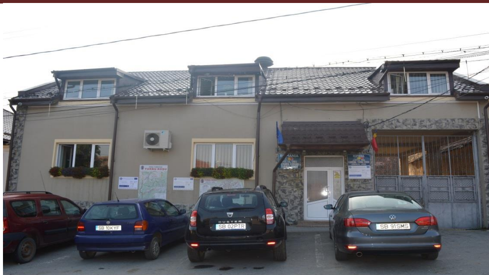
Primăria Comunei Turnu Roșu