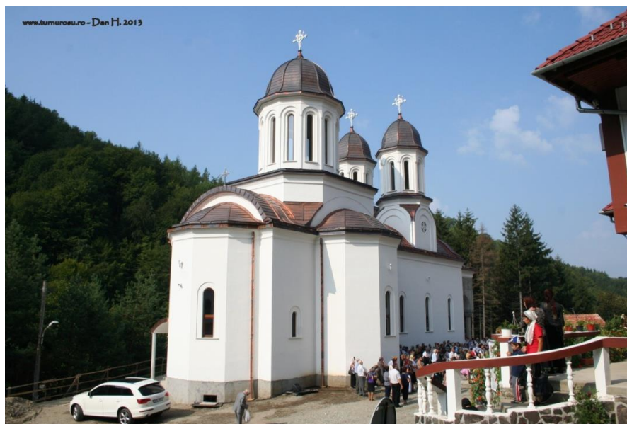
Mănăstirea „Adormirea Maicii Domnului,, Turnu Roșu