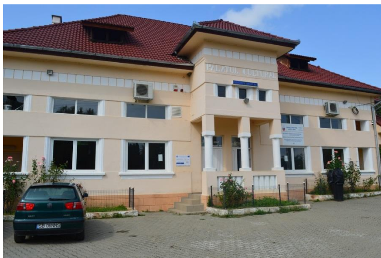
Căminul Cultural „Sebeșu de Jos,,