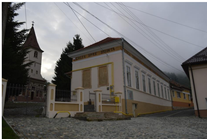
Muzeul Arte Populare Turnu Roșu