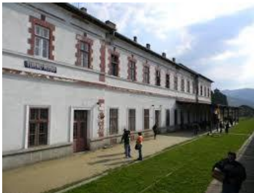
Halta Comercială Turnu Roșu