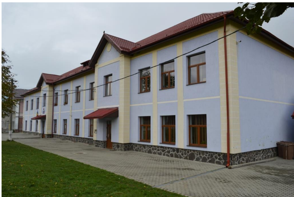
Școala Gimnazială,,Matei Basarab,, Turnu Roșu