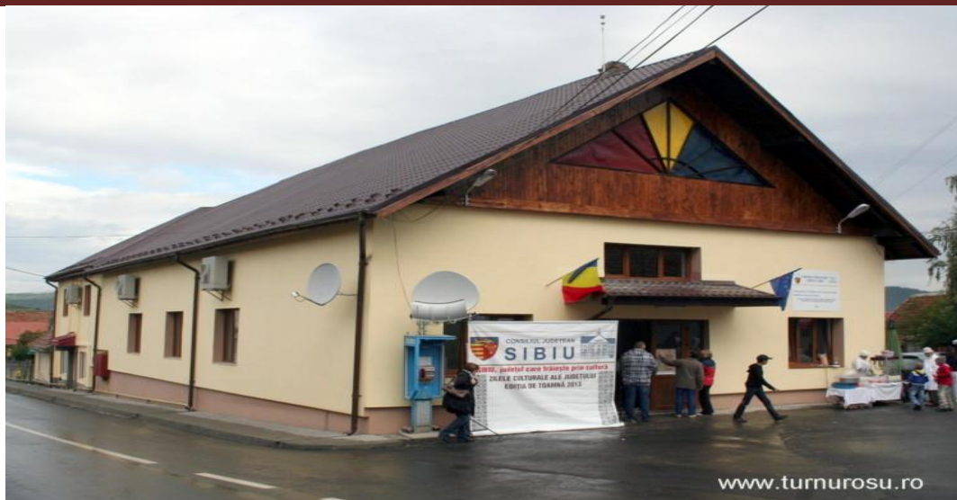
Căminul Cultural „Regele Mihai I,, Turnu Roșu